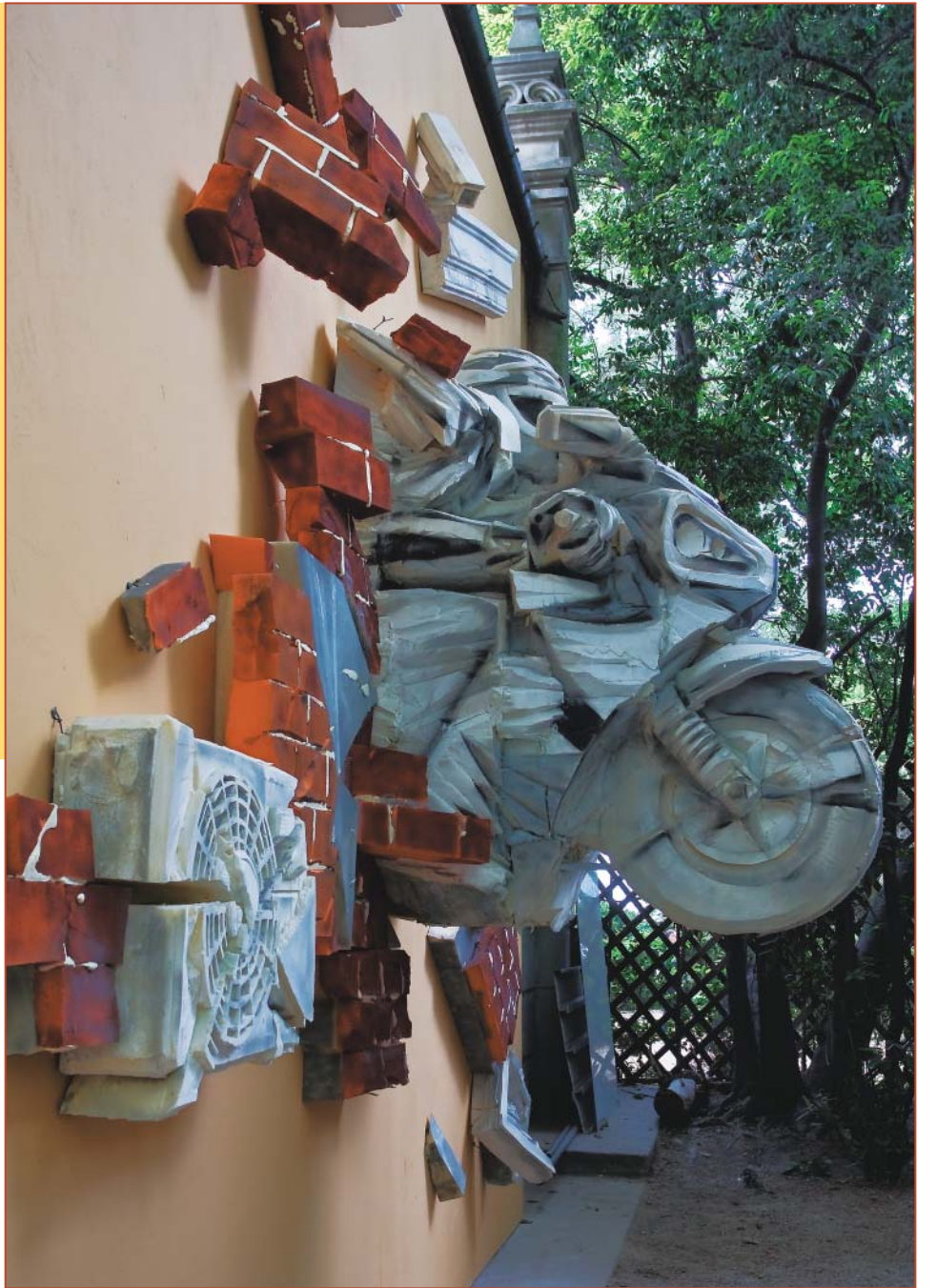
СЕРГЕЙ ШЕХОВЦОВ. Гонщик