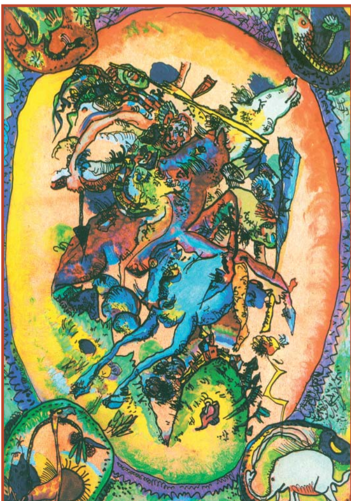
Всадники Апокалипсиса. 1910 Городская галерея Ленбаххауз, Мюнхен