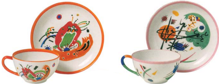
Чашка с блюдцем. Начало 1920-х. Музей высшего художественно-промышленного училища