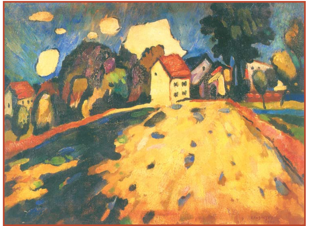
Мурнау. Дома на холме. 1909. Частное собрание