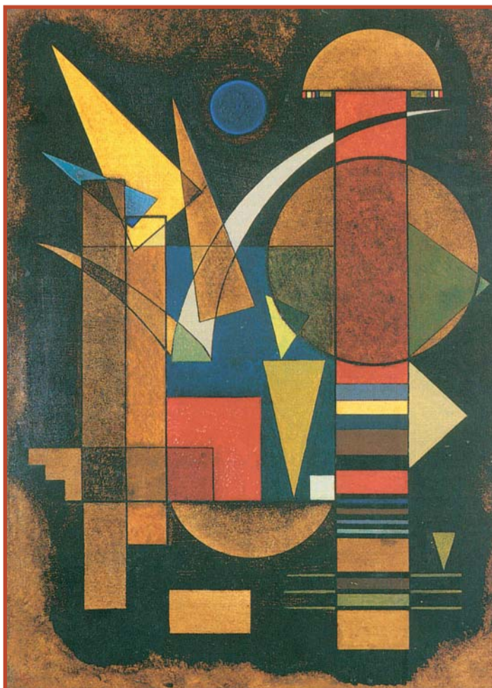
Синее на многоцветном. 1925. Государственный музей изобразительных искусств им. А.С. Пушкина, Москва