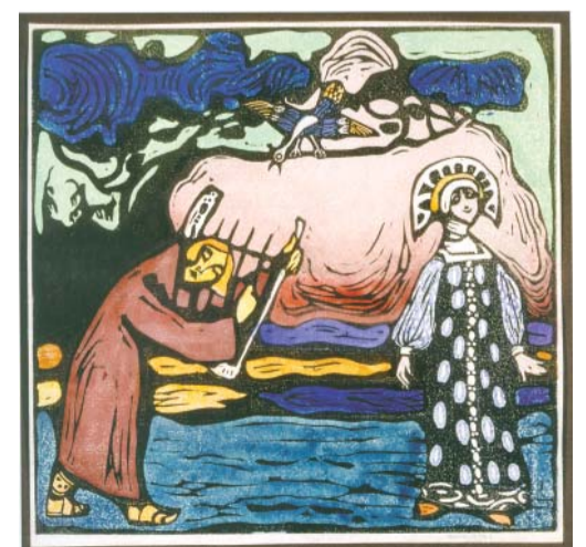
Гусляр. 1907 Государственная Третьяковская галерея, Москва