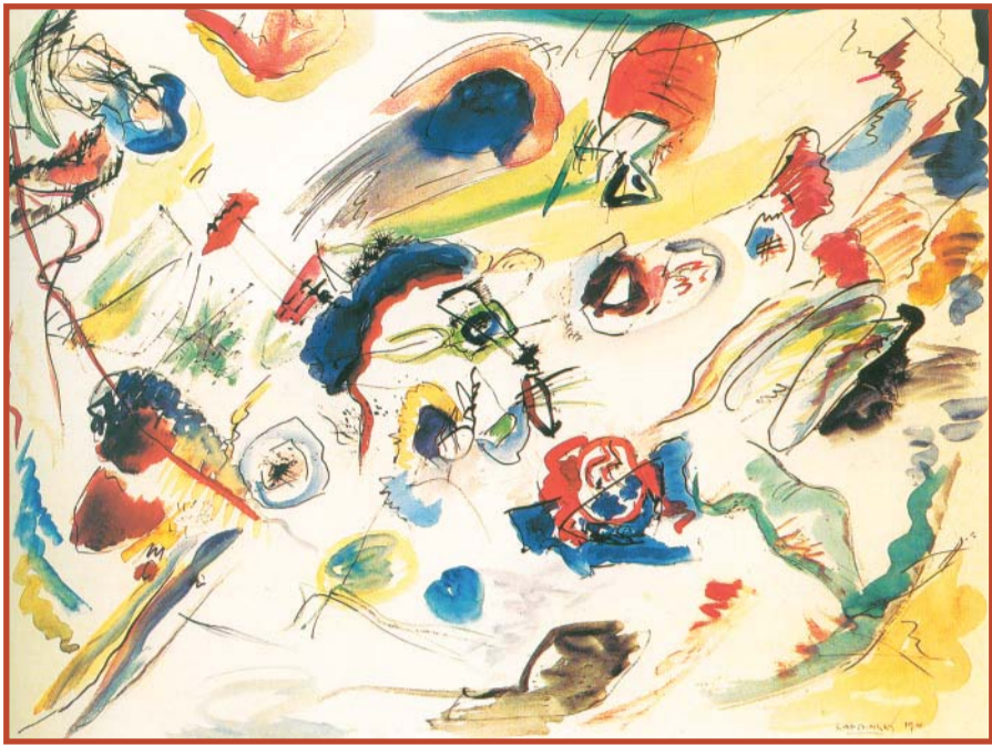
Без названия (Первая абстрактная акварель). 1910. Центр Жоржа Помпиду, Париж