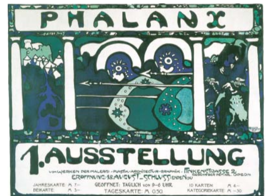
Плакат первой выставки общества «Фаланга» 1901. Городская галерея Ленбаххауз, Мюнхен